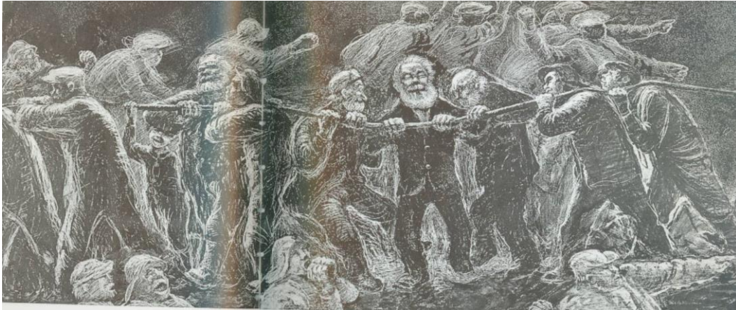
Mehamn -affæren. Tegning av Kåre Espolin Johnsen

Fiskeran ville ha kvalen freda, men storting og regjering tøyde saken ut – til støtte for kapitalinteressene som den gang sto for kvalfangsten.